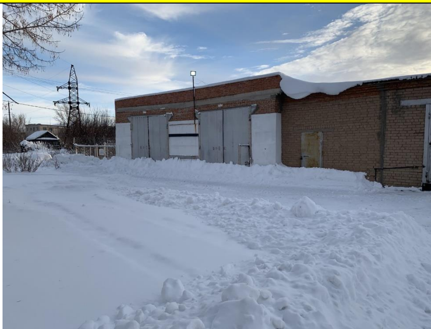
Фото объекта недвижимости