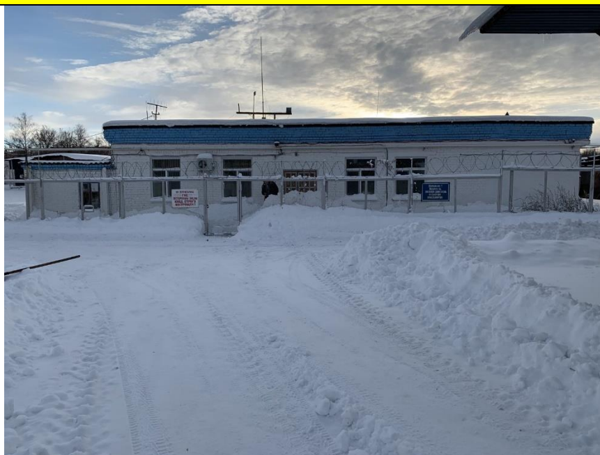
Фото объекта недвижимости