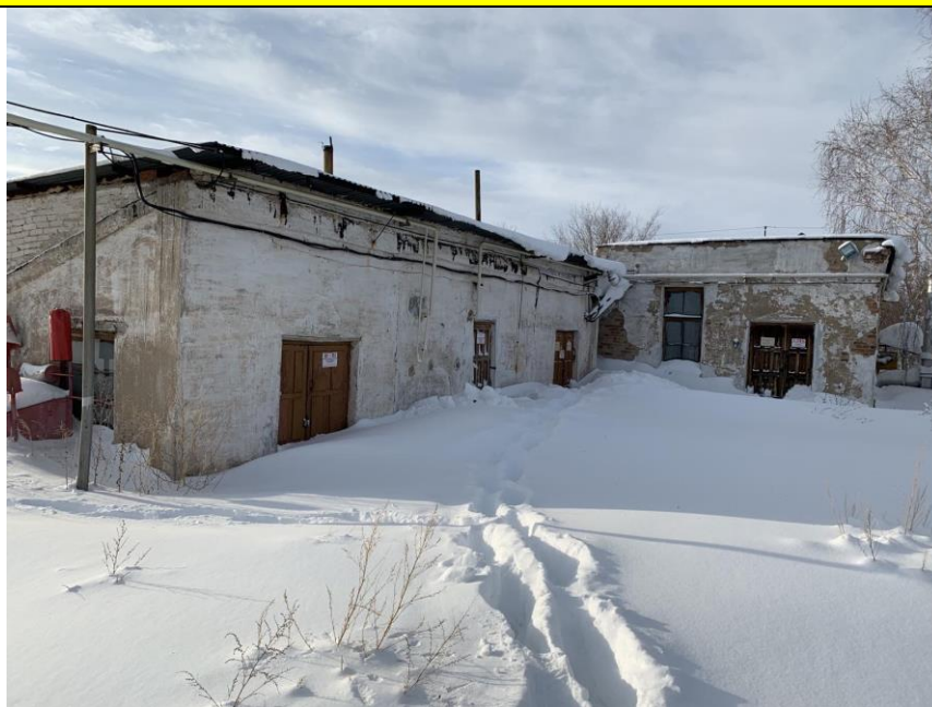
Фото объекта недвижимости