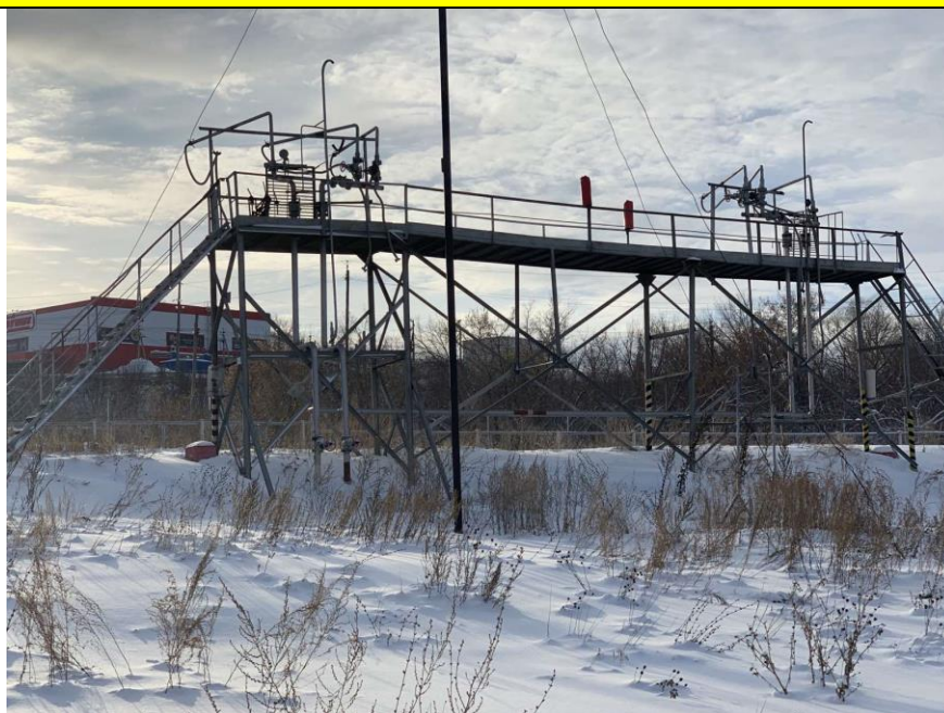
Фото объекта недвижимости