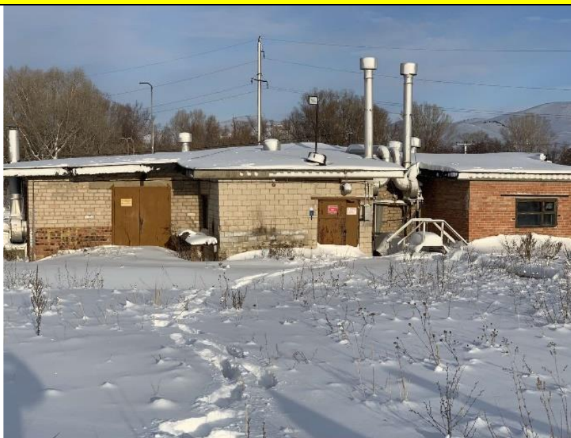
Фото объекта недвижимости