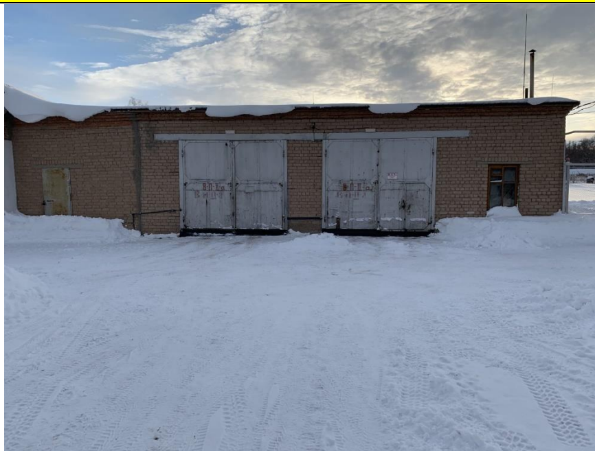
Фото объекта недвижимости