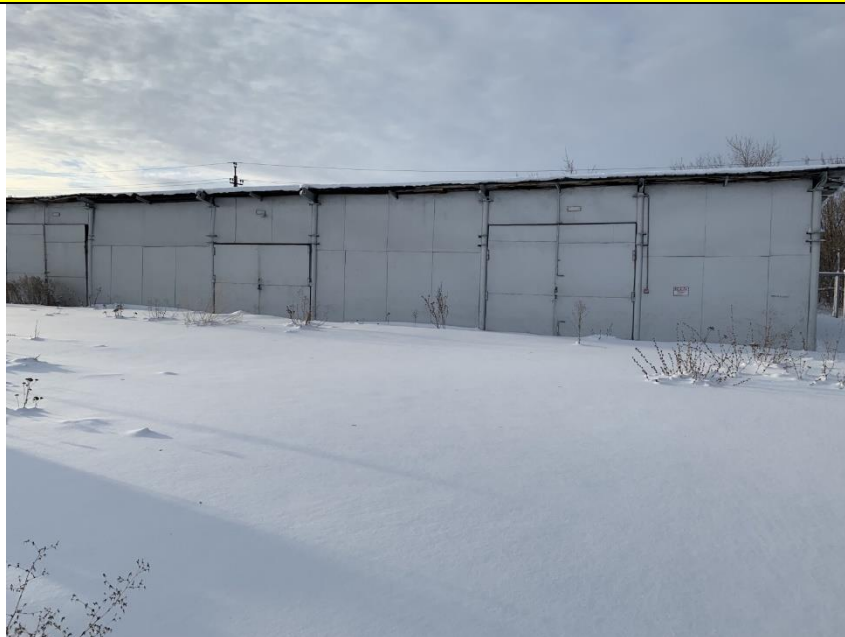
Фото объекта недвижимости